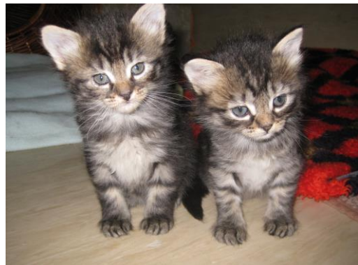
Zwei der fünf Katzenkinder

So zog auch Mohrchen bei lieben Menschen ein, die sie sich als „neue Herrchen“ ausgesucht hatte. Nachdem niemand die Katze vermisste, wurde Mohrchen zum Tierarzt gebracht und gut versorgt. Nach einiger Zeit stellte sich heraus, dass Mohrchen trächtig war und da sich die „Ersatzherrchen“ aus Altersgründen eine Kinderstube nicht mehr zutrauten, kam die liebe schwarze Katze ins Katzenhaus. Hier bekam sie ein „Einzelzimmer“ und brachte an Ostern fünf Katzenbabys zur Welt. Das war für uns alle ein wunderbares Ereignis. Mit ganz viel Liebe, Aufmerksamkeit und Rücksichtnahme wurde die kleine Familie umsorgt. Nun sind die Kleinen schon neun Wochen alt und toben quirlig in ihrer „Kinderstube“ umher.