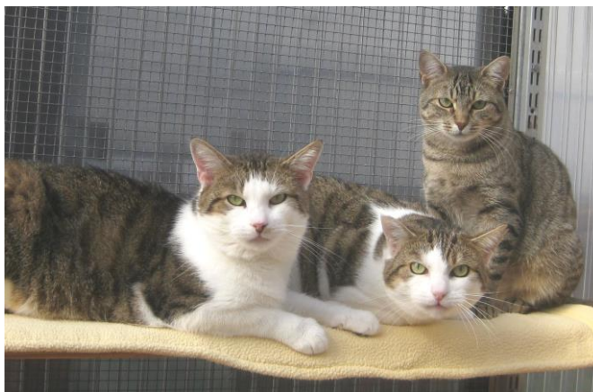
Linus, Kenny und Babette

Auch das zweite halbe Jahr 2018 ist fast wie im Fluge vergangen. Das Jahresende rückt näher, die Vorweihnachtszeit hat begonnen und wir möchten Ihnen gerne wieder von unserer Arbeit berichten. Zunächst bedanken wir uns ganz herzlich bei allen Helferinnen und Helfern, die durch ihr Engagement die Versorgung der Katzen möglich gemacht haben. In diesem Jahr konnten wir einige neue Mitarbeiterinnen und Mitarbeiter für unser Team gewinnen. Dies freut uns alle sehr, denn im Tierschutz braucht man jede helfende Hand und den Katzen ist jeder herzlich willkommen, der neben der Arbeit noch Zeit für kleine Streicheleinheiten hat.