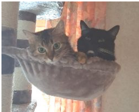
Carla und Puschkin

Zunächst einmal können wir berichten, dass alle Geschwisterpaare, die im Dezember noch auf die richtigen Frauchen und Herrchen warteten, ihr Zuhause gefunden haben. Ganz besonders hat uns die Vermittlung des schüchternen Ginos und seiner Freundin Cherry gefreut. Sie haben ein schönes Zuhause bei einer Familie mit Hund und weiterem Kater gefunden. Wir haben tolle Bilder und Videos der beiden erhalten, die uns zeigen: Es geht ihnen wirklich gut.