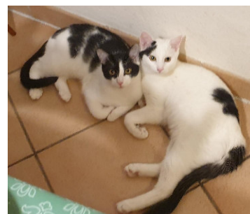
Yogi + Olli im neuen Zuhause

Es macht uns sehr glücklich, dass wir schon einige Katzenkinderpaare sehr gut vermitteln konnten. So zogen zuerst Onella und Olivia, danach Alicia und Hanni sowie Yogi und Olli ins neue Zuhause. Auch Antonio und Ofelia sind nun im neuen Leben angekommen und es ist immer schön zu sehen, wie glücklich alle Katzen sind, einen Freund oder Freundin bei sich zu haben. Das bestärkt uns sehr im Bestreben, kleine Katzen nur paarweise zu vermitteln.